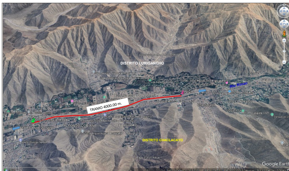
5.- IMAGEN SATELITAL DE ZONA VULNERABLE(GOOGLE EARTH)