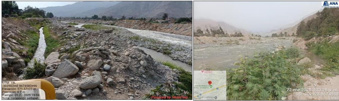
ZONA COLMATADA DEL RIO RIMAC